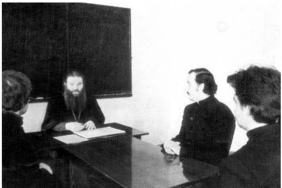
На зачете в семинарии

Мой отец был носителем той же традиции, и, познакомившись с нашей мамой, которая была намного моложе его, наполнял ее жизнь глубоким жизненным опытом, основанным на православном мировоззрении. Они любили друг друга. Когда отец стал немощным, мама оставила все и ухаживала за ним. Оставшись одна в сравнительно молодом возрасте, она посвятила себя молитве за всех нас. Мне очень приятно, что духовенство и прихожане помнят маму. Она, как и я, радовалась открытию нашего