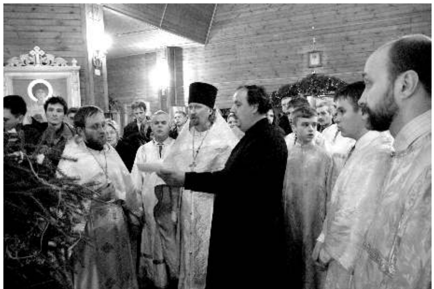
Рождество Христово. 2009 год

– Наш храм всей семьей мы начали посещать со второй службы. Первую пропустили, так как не знали о ней. Нам этот