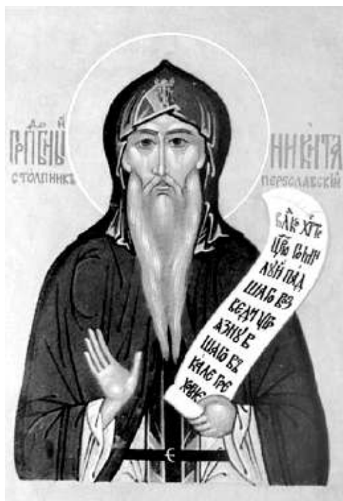
Прп. Никита Столпник

Однажды, во время очередного застолья с друзьями, жена Никиты, готовя кушанья, испуганно позвала его на кухню. Он пошел на зов жены. На кухне его взору предстало ужасное зрелище: в кипящем котле пенилась кровь, а в ней – человеческие руки, ноги, головы. Страх и трепет напали на Никиту. Оставив жену, детей, несправедно нажитое богатство, он ушел из дома. Потрясенный страшным видением, Никита пришел в монастырь великомученика Никиты и со слезами припал к ногам игумена с просьбой спасти его погибающую душу.