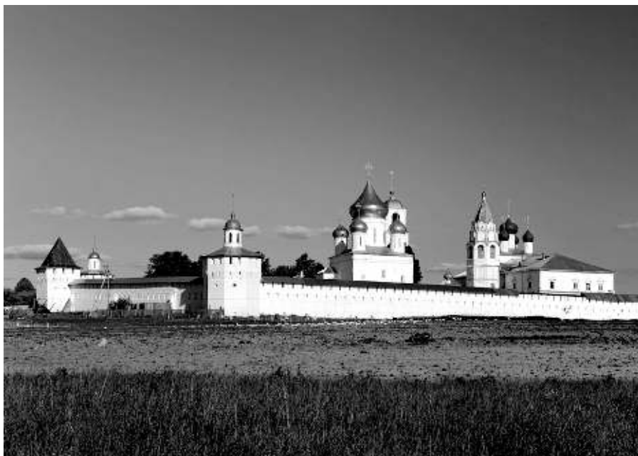
Никитский мужской монастырь

Первым его послушанием было стоять при монастырских воротах и исповедовать свои грехи всем проходящим мимо. Много слез пришлось пролить ему, потому что никто не верил в искренность его покаяния. Всем сердцем приняв монашеские обеты, новопостриженный монах Никита предался подвигам покаяния: возложив на себя тяжелые железные вериги и каменную шапку, без сна проводил дни и ночи, пребывая в посте и молитве в ископанном земляном столпе. Так протекали дни, за ними и годы. Изнурительные труды, пламенные молитвы и покаяние во грехах Господь принял от Никиты как жертву чистую и благоуханную и благоволил прославить его еще при жизни, послав ему дар исцеления. И потекли к преподобному реки людские за исцелением от болезней, утешением в скорбях, вразумлением и наставлением.