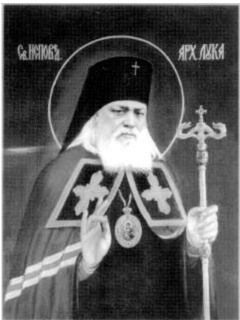
Свт. Лука Войно-Ясенецкий