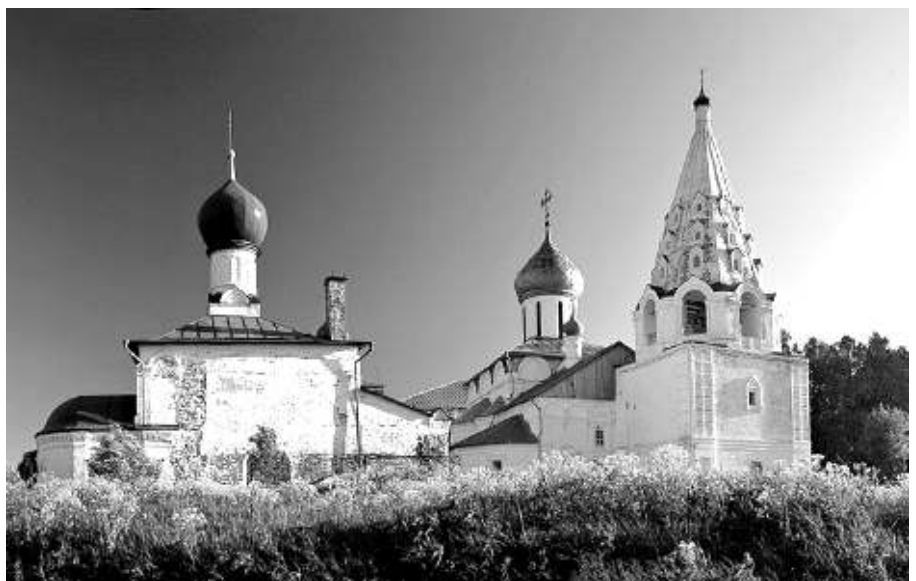
Свято-Троицкий Данилов монастырь

Полученные впечатления не передать словами. Мысленно я пока там, в Переславле. Меня поразили красота и вид, который открылся нам, когда мы прошли через святые врата Троице-Данилова монастыря. Белоснежные храмы и монастырские стены, аккуратно стриженная, еще зеленая трава, ровные дорожки,