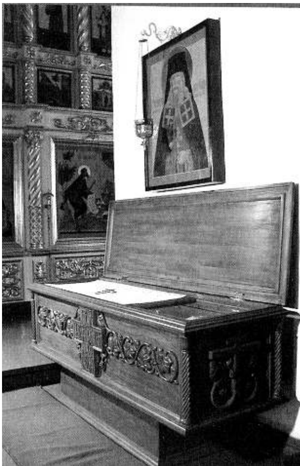
Рака с мощами преподобноисповедника Александра Санаксарского

Занимались церковные помещения. Там хранили зерно и хлеб.