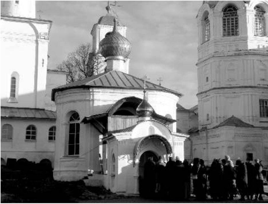
Часовня в Никитском монастыре на месте столпа прп. Никиты

Однажды пришли к преподобному его родственники с просьбой помолиться за них. Случайно блеснули вериги под расой батюшки. Показалось нечестивцам, что вериги из чистого серебра, и, наученные злым духом, задумали они погубить святого старца. Среди ночи разобрали крышу столпа и убили подвижника, сняли крест, тяжелые вериги, в темноте не рассмотрев, что они железные, и убежали.